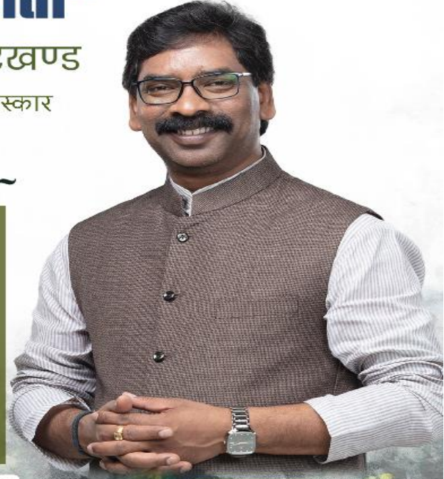
श्री हेमन्त सोरेन माननीय मुख्यमंत्री